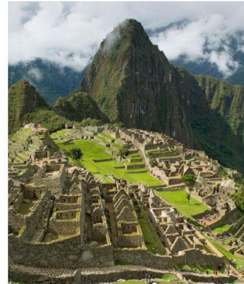
22 Machu Picchu (Peru).

Beeld aanpassen (staat niet in beeldmap)