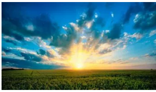
Machtiger dan de zon