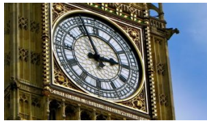
De Big Ben in Londen - De beroemdste klok ter wereld