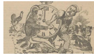
Boer Braat, de man die de zomertijd haat